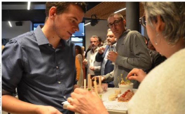
Judi soir, les « Ateliers » ont donné un premier aperçu gargantuesque de leur savoir-faire.

Judi soir, assaut de zakouskis à la maison rurale où était inaugurée la Terrasse des compagnons. Le 3 e restaurant didactique des Ateliers de Pontauray y régale pour la bonne cause de l'emploi dans un secteur en pénurie.